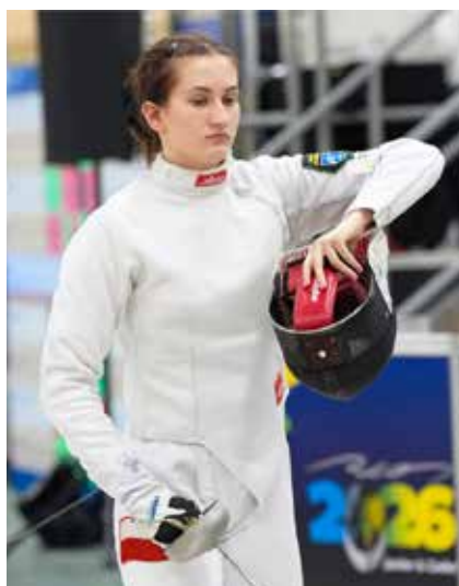
MAT. PRASOWE RMKS-U RYBNIK