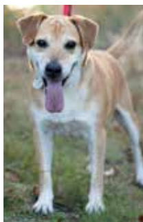
Fenek – średniej wielkości psiak w wieku 11 lat. Przyjazny do ludzi. Nie przepada za innymi psami.