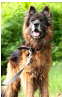
Roki – owczarek niemiecki, 9 lat. Przyjazny do ludzi. Nie lubi innych psów.