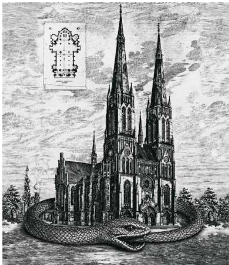
Procesja z figurą św. Antoniego musiała ruszyć w miasto, bo jakby szła tylko wokół kościoła, to by się jak żmija ugryzła we własny ogon (fotomontaż w oparciu o rycinę, będącą pamiątką wmurowania kamienia węgielnego kościoła św. Antoniego w dniu 13 czerwca 1904 roku)