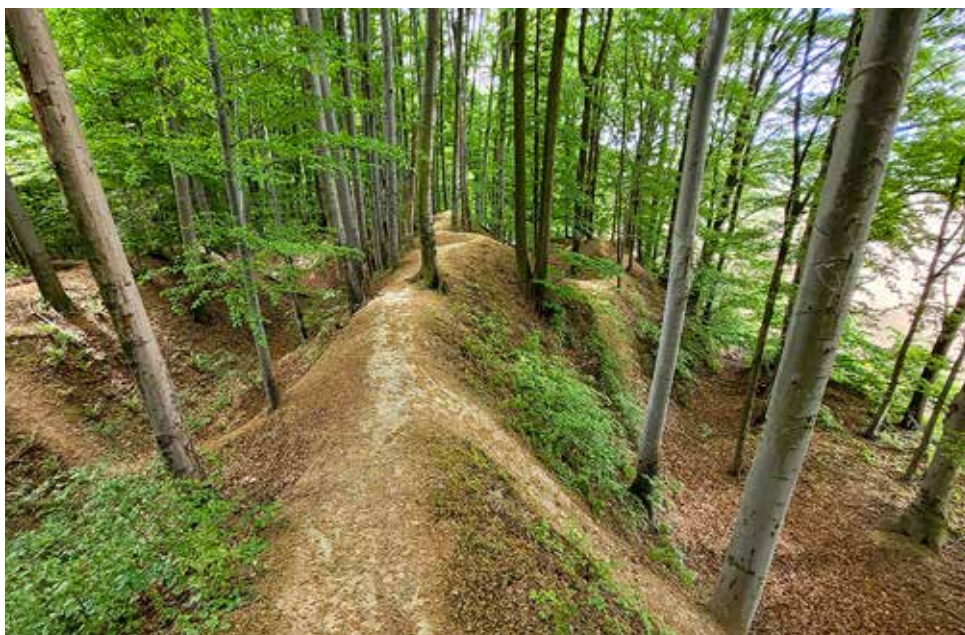
Choć minęło około tysiąca dwustu lat, to w grodzisku w Lubomi do dzisiaj widać pozostałości dwóch pierścieni ziemnych wałów.

Zacznijmy od tego, że nazwa śląskiej miejscowości „Lubomia” w drugim przypadku pisze się przez jedno „i”, czyli „Lubomi”. Natomiast odległość z Rybnika do Lubomi to zaledwie 20 km. To idealny dystans na letnią wycieczkę rowerową. Trzeba ruszyć w kierunku na Racibórz i w Rzuchowie skrócić w lewo. Droga jest oznakowana, ale najlepiej „wklupać” do telefonu na GPS cel: „Lubomia Grodzisko Gołęźyców”. A dlaczego warto się tam wybrać?