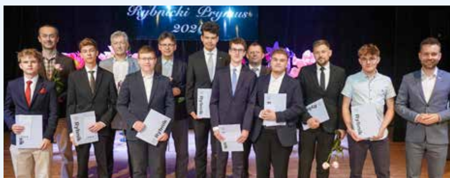
Uczniowie II LO z wiceprezydentem miasta