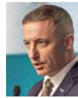
Piotr Kuczera prezydent Rybnika

„W życiu ważne są symbole. Elektrownia jest symbolem miasta. Kilka lat temu, na 60-lecie obecności Politechniki Śl. w Rybniku, zaproponowałem hasło: od Rybnickiego Okręgu Węglowego do Rybnickiego Okręgu Wodorowego. Można to rozumieć dosłownie, ale także jako symbol transformacji całego regionu. Ta transformacja powinna być sprawiedliwa. I na to jako samorządy woj. śląskiego bardzo, bardzo liczymy.”