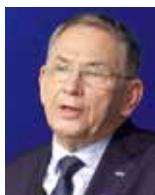
Dariusz Lubera Prezes Zarządu PGE

„Wiemy, że OZE i atom to przyszłość. Ale gaz to most, którym musimy przejść między węglem a energetyką zeroemisyjną. I ten most budujemy dziś – w Rybniku i Gryfinie. Podpisujemy umowy na budowę 2 elektrowni gazowych na łączną kwotę 6 mld zł. Ale już dziś w Rybniku realizowana jest budowa największego w Polsce i najbardziej efektywnego bloku gazowego, który zapewni energię elektryczną dla 2 mln gospodarstw domowych”.