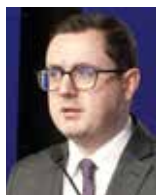
Miłosz Motyka Minister Energii

„Podpisanie umów na budowę nowych szczytowych elektrowni gazowych w Rybniku i Gryfinie to decyzja strategiczna, która wzmacnia fundament bezpieczeństwa energetycznego Polski. Rozwijamy odnawialne źródła energii i przygotowujemy fundament pod energetykę jądrową, ale równolegle musimy zapewnić systemowi moce, które będą w stanie szybko reagować, utrzymać bilans oraz zagwarantować ciągłość dostaw”.